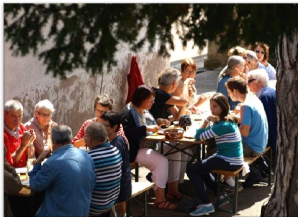
La pause repas – stage 2013

Cependant les Vêpres œcuméniques seront marquées par la manière de Claude Goudimel dont nous fêtons cette année le 500 e anniversaire de sa naissance. Une occasion de rendre un hommage particulier à l'un des grands artisans du répertoire protestant et qui a même une place non négligeable dans le répertoire catholique.