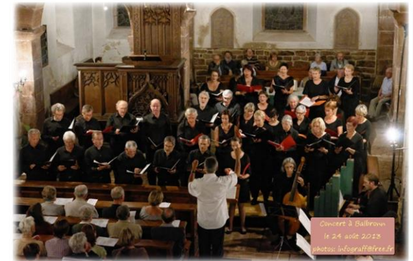
Concert de fin de stage août 2013 - Balbronn

Chant choral du 18 au 24 août 2014 et atelier solistes à partir du 16 août