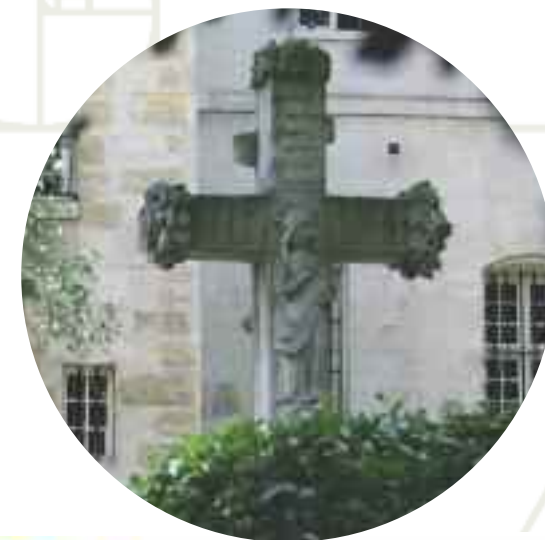
Photo de couverture : Croix du Jardin des Carmes / Service Communication ICP 11/2009

Session organisée par l'ISL en collaboration avec le 1 er Cycle du Theologicum