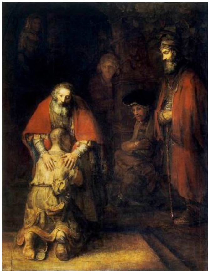
Le Retour du Fils prodigue, Rembrandt, vers 1668, musée de l'Ermitage de Saint-Petersbourg.

Curé d'Etampes, délégué PLS du diocèse d'Evry-Corbeil-Essonne