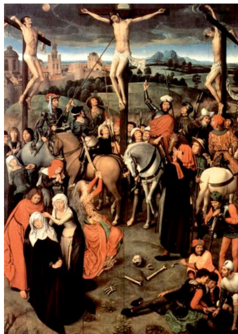
La Crucifixion, panneau central du triptyque Greverade, Hans Memling, 1491, musée Sainte-Anne de Lübeck.

Nous savons que le mot miséricorde a un rapport avec les entrailles, celles d'une mère si attachée à son enfant. Le judaïsme situe toujours de manière concrète un sentiment ou une qualité divine. Cela nous permet de percevoir que ce n'est pas de la théorie ou un pur concept. La miséricorde fait résonner les mots tendresse, bonté, on pourrait dire « avoir du cœur » et cela s'applique à Dieu. C'est l'idée d'un lien viscéral qui m'attache à l'autre. La miséricorde fait résonner également les mots pardon, compassion, on pourrait dire « être touché au cœur ». C'est en somme l'action même de la réalité « Miséricorde ». La miséricorde fait résonner les mots piété, fidélité ; on pourrait dire « ouvrir son cœur à quelqu'un ». C'est la réponse consciente et voulue à la relation.