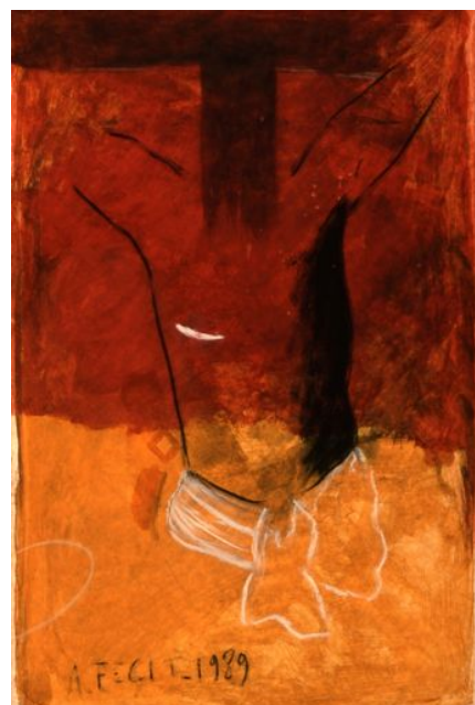
Le Sacré-Cœur de Jean-Michel Albérola, signé et daté A. Fecit, 1989.

Tout comme celles du dimanche, les lectures de la solennité du Sacré-Cœur de Jésus varient en fonction de l'année liturgique. Une approche attentive des textes choisis par le lectionnaire permet de comprendre comment l'Église fait contempler sous trois angles différents le mystère inépuisable de l'amour divin.