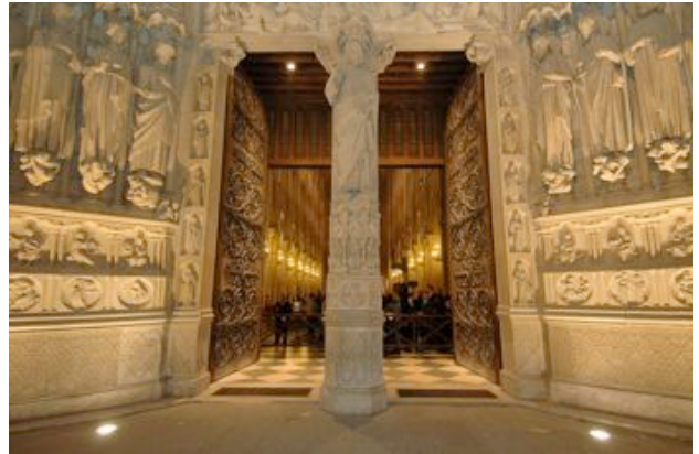
Portail principal de la Cathédrale de Paris (75), France.

Nous franchissons un certain nombre de portes dans notre vie quotidienne : porte de l'appartement ou de la maison pour entrer chez nous ; porte de notre chambre pour être tranquille ; porte de l'école, du club de foot ; portes de la ville (par exemple, la porte de La Chapelle à Paris). Franchir la Porte Sainte n'est pas franchir une porte ordinaire : cela peut changer le sens et la valeur de chaque porte traversée par notre vie.