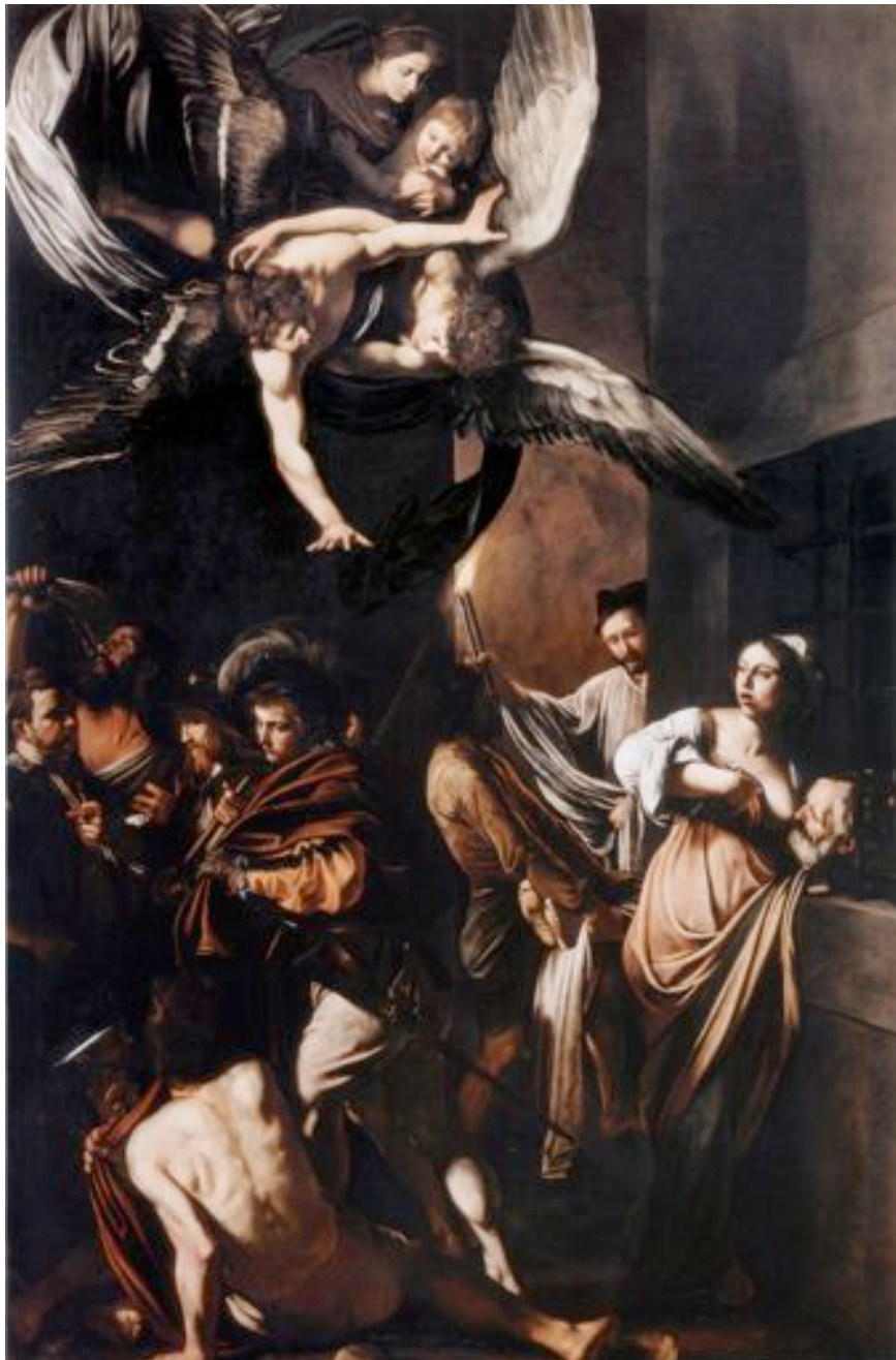
Huile sur toile, 390 cm x 260 cm, 1606 - 1607 Eglise Pio Monte della Misericordia à Naples