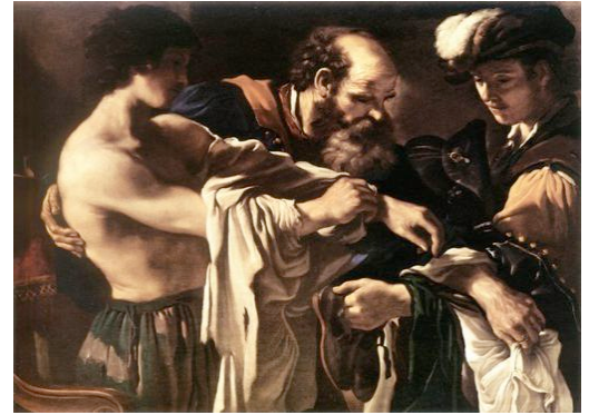
Guercino Le fils prodigue , 1619, huile sur toile, 107 x 143.5 cm

Peu de commentateurs se sont intéressés au paragraphe 22 de la bulle d'indiction pour l'Année de la miséricorde, consacré à l'indulgence. La dispute sur les indulgences a marqué la mémoire collective des catholiques. À l'heure du dialogue œcuménique, cette problématique n'est-elle pas devenue anachronique ? Il est utile d'en esquisser l'histoire et d'en dégager la signification essentielle.