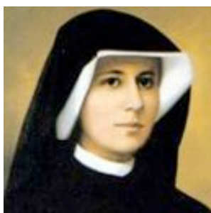
Soeur Faustine

Le renouveau d'intérêt pour la miséricorde n'est pas que théologique ou pastoral. Depuis quatre-vingts ans, il est aussi largement dévotionnel. Au-delà des questions de sensibilité, que peut nous apprendre une pratique populaire comme celle de ce petit chapelet ?