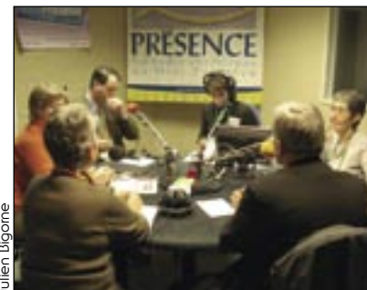
Avec le soutien technique de Radio Présence