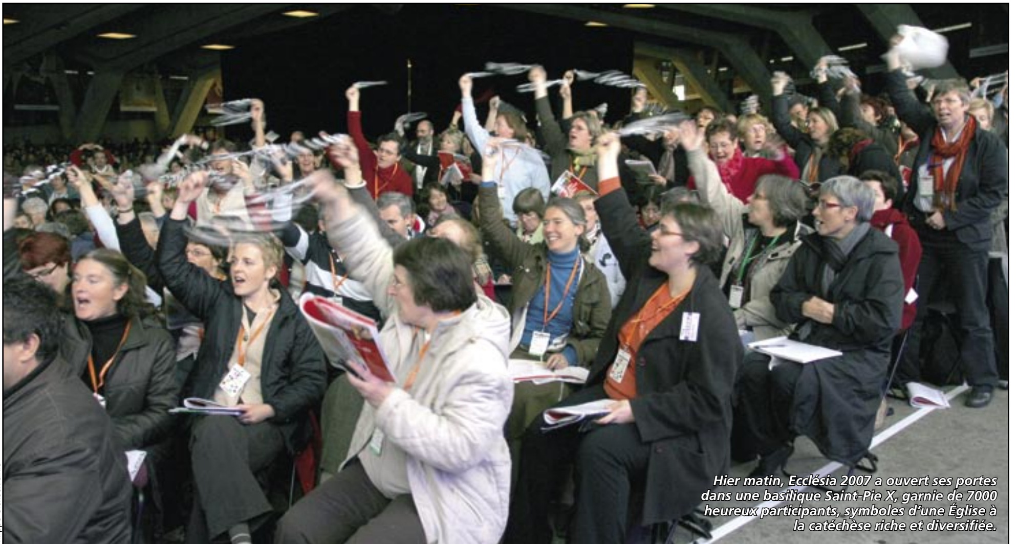
Hier matin, Ecclesia 2007 a ouvert ses portes dans une basilique Saint-Pie X, garnie de 7000 heureux participants, symboles d'une Église à la catéchèse riche et diversifiée.